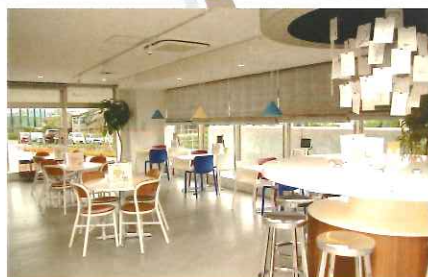
レストラン プラスメディ▶